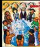
Las Culturas en Diálogo