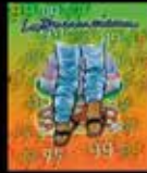
Patria Grande en Éxodo