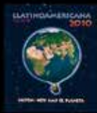
Salvémonos con el Planeta