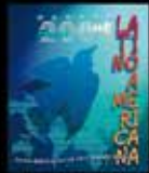
Cómo debería ser el otro 'mundo posible'