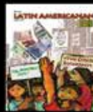
La Otra Economía