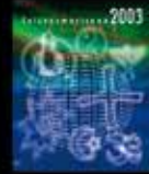
Las religiones en paz para la paz del mundo