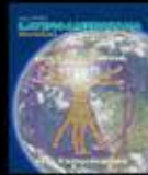
Para otra Humanidad, otra Comunicación