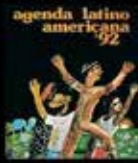
1992: 500 Años