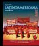
Hacia un socialismo nuevo. La Utopía continúa