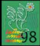
Una Patria en otra Paz