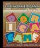
Exigimos y hacemos otra Democracia