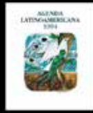
En el Espíritu de la Patria Grande