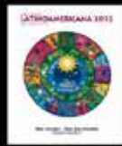
Buen Vivir- Buen Convivir