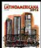
Desigualdad y Propiedad