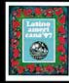
Una Patria de Patrias Hermanas