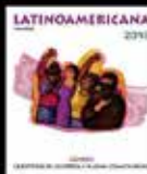
Género Cuestión de Justicia y nueva cosmovisión