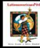
Patria Grande y Patria Mundial