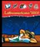
Patria Grande sin deudas