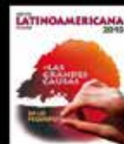
Las Grandes Causas en lo Pequeño