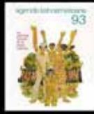
Las grandes causas de la Patria Grande