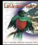
Patria Grande. Patria Mundial