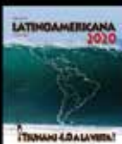
La Revolución Digital que viene

...Y DE UNA NUEVA VISIÓN. 29 AÑOS, EN 20 PAÍSES, EN 4 IDIOMAS