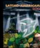
La política murió... ¡Viva la Política!