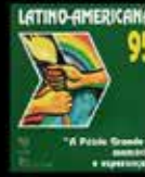
La Patria Grande es Memoria y Esperanza