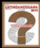
¿Qué Dios? ¿Qué religión?