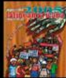
Desnudando al nuevo Imperio